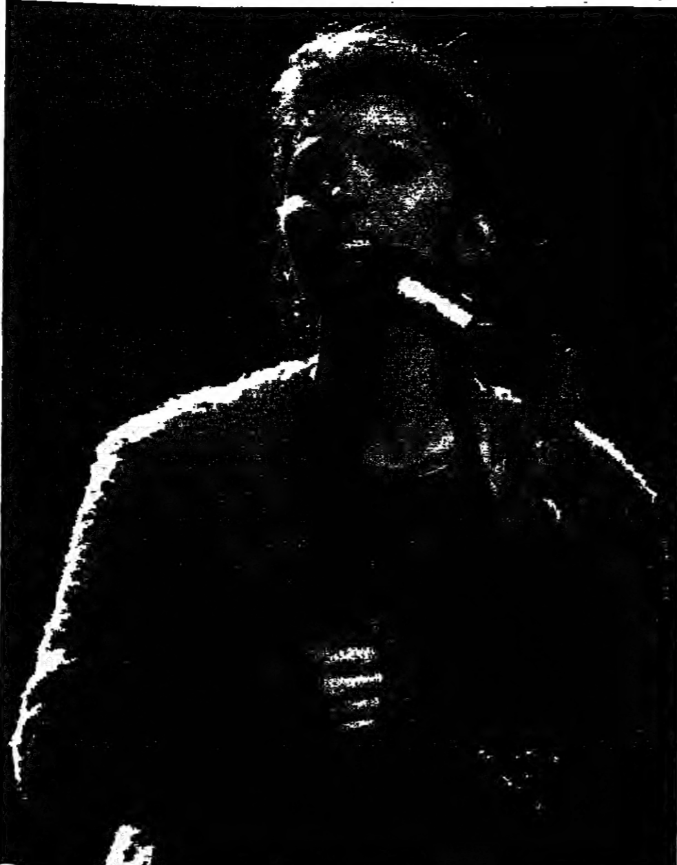
الغنية الكندية شانيا تروني تقوم بالاعداد للمشاركة في الاحتفال بمرور نصف قرن على انشاء مئة الامم المتحدة لرعاية الطفولة (يونيسيف) الذي يقام في نيويورك

■ مران (القرب) - ريتار: قال رجل الاعمال البريطاني ويدهار برانسون امس انه عثر على بالونه المفقود الذي انطلق من القرب بدون اسلاك داخل الاراضي الجزائرية. وقال المليونير البريطاني للصحافيين من قاعدة القرب من مدينة مران في الغرب بلق بلق طلبا منهم (الجزائريون) احداث قطع بالون في البالون طوله ثلاثة امتار. وانطلق بالون برانسون قبل سبعة ايام من القرب واربعة وعشرين ساعة ولم يصب احد عتسا انطلق البالون من القرب مارا فوق جبال اطلس متجها نحو الجزائر. ويستهدف اجراء احداث قطع في البالون منه من الانطلاق مرة اخرى في حالة ارتفاع درجة حرارة غاز الهيليوم الموجود داخله مع تقدم اليوم. وقال برانسون ان مسجولين من الجيش الجزائري وصلوا الى مكان البالون في ذلك طرفة سنجها 75 في المئة لاستعادته. وتكر ان الجزائريين طلبوا الحصول على تسوية مكتوب باحداث قطع في البالون وانه جاري الاستجابة لطلبهم. ويقوم برانسون بمحاولة جديدة للهباط حول العالم دون توقف في رحلة من اثني ان يقع خلالها 30600 كيلومتر. وسيجتاز برانسون في رحلته مساعده اليكس ريتشي (52 عاما) وبيتر بريتسراند (49 عاما) وهو ناس القرب الذي صاحبه في محاولة الهبوط في الساقية في كانون الثاني (يناير) للماضي والذي اقترب ايضا بهبوط اضطراري في الجزائر المجاورة.